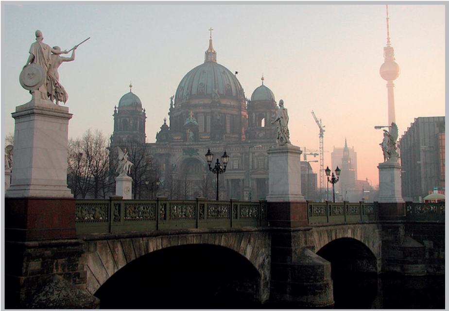
Berliner Dom mit Schlossbrücke